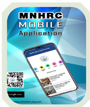
Mnhrc Mobile Application