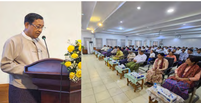
ဒီဇင်ဘာလ ၂၉ ရက် မြန်မာနိုင်ငံအမျိုးသားလူ့အခွင့်အရေး ကော်မရှင်

မှ ကော်မရှင်ဥက္ကဋ္ဌ၊ ဒုတိယဥက္ကဋ္ဌ၊ ကော်မရှင်အဖွဲ့ဝင် များ၏ ဇနီးများအတူ ကော်မရှင်ရုံး အရာထမ်း/ အမှုထမ်း များပါဝင်သည့် ၂၀၂၄ ခုနှစ်၊ နှစ်သစ်ကူးအကြံ့ အခမ်း အနားကို အစီအစဉ် (၂) ပိုင်းခွဲ၍ ကျင်းပခဲ့ပါသည်။ အခမ်း အနား ပထမပိုင်း အစီအစဉ်ကို ၂၀၂၃ ခုနှစ်၊ ဒီဇင်ဘာလ ၂၉ ရက်နေ့ ၁၄:၀၀ နာရီအချိန် ကော်မရှင်ရုံး Conference Room တွင် ကျင်းပပြုလုပ်ရာ ဦးစွာ ကော်မရှင်ဥက္ကဋ္ဌက အဖွင့်အမှာစကားပြောကြားခဲ့ပြီး ကော်မရှင်ဒုတိယဥက္ကဋ္ဌ က အမှာစကားပြောကြားပါသည်။