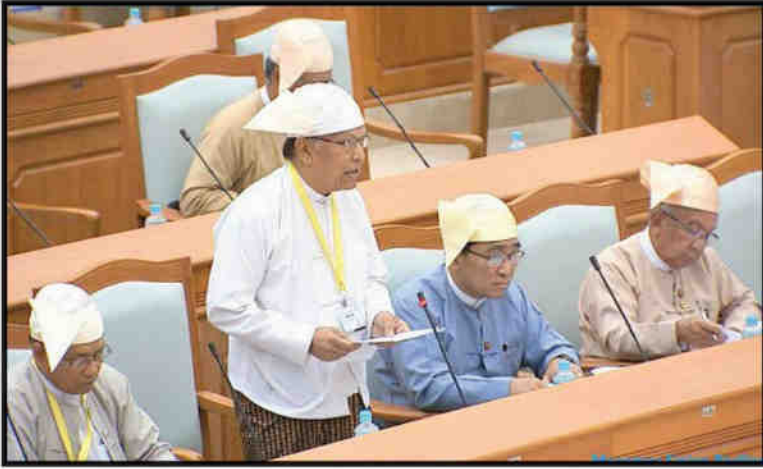
ဒုတိယအကြိမ် ပြည်ထောင်စုလွှတ်တော် အဋ္ဌမပုံမှန်အစည်းအဝေး စတုတ္ထနေ့ လွှတ်တော်ကိုယ်စားလှယ်များ၏ ဆွေးနွေးချက်များအပေါ် မြန်မာနိုင်ငံအမျိုးသား လူ့အခွင့်အရေးကော်မရှင်မှ ပြန်လည်ရှင်းလင်း တင်ပြခြင်း (၂၉-၅-၂၀၁၈)