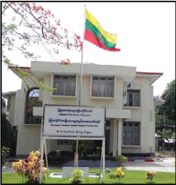
မြန်မာနိုင်ငံ အမျိုးသား လူ့အခွင့်အရေး ကော်မရှင် (ရုံးချုပ်)

၂၀၁၁ ခုနှစ် စက်တင်ဘာလ (၁၉) ရက်နေ့တွင် ယခု ကော်မရှင် ရုံး တည်ရှိရာ အမှတ် (၂၇)၊ ပြည်လမ်း၊ လှိုင်မြို့နယ်၊ ရန်ကုန်မြို့သို့ ပြောင်းရွှေ့ခဲ့ပြီး ယင်းနှစ် နိုဝင်ဘာလ ၃ ရက်နေ့တွင် ရုံးဖွင့်ပွဲ ပြုလုပ်ခဲ့ ပါသည်။