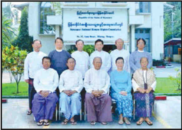
၂၀၁၄ ခုနှစ်မှ ၂၀၂၀ ပြည့်နှစ် ဇန်နဝါရီလအထိ တာဝန်ထမ်းဆောင်ခဲ့သော ကော်မရှင်အဖွဲ့ဝင်များ