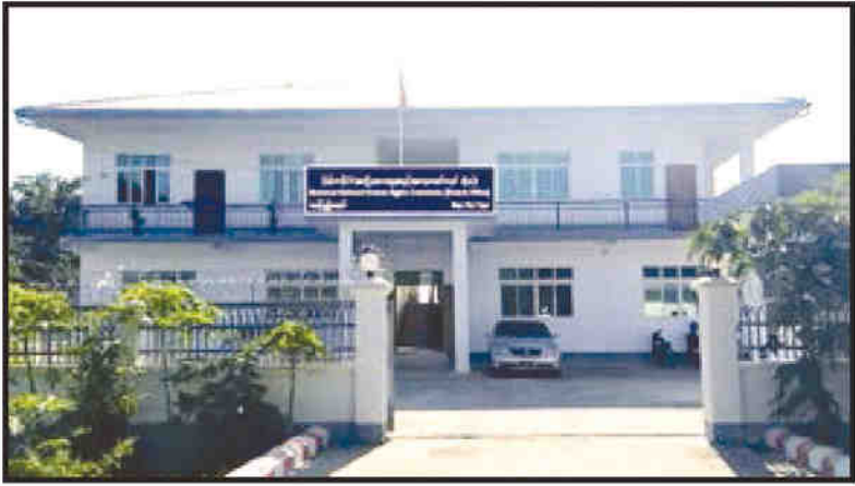
မြန်မာနိုင်ငံအမျိုးသားလူ့အခွင့်အရေးကော်မရှင် နေပြည်တော် (ရုံးခွဲ)