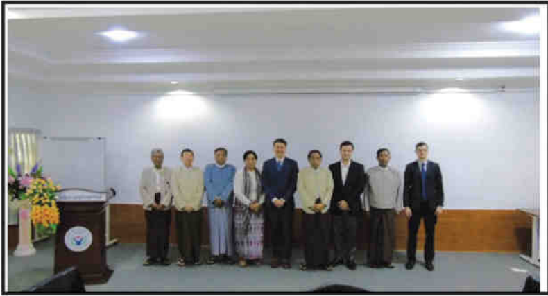
မြန်မာနိုင်ငံအမျိုးသားလူ့အခွင့်အရေးကော်မရှင်နှင့် ကုလသမဂ္ဂဖွံ့ဖြိုးမှုအစီအစဉ် (UNDP) မှ ကိုယ်စားလှယ်အဖွဲ့တို့ တွေ့ဆုံဆွေးနွေးခြင်း (၁၀-၃-၂၀၂၁)