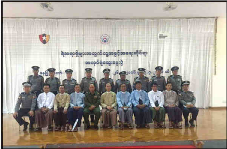
အမှတ်(၁) လုံခြုံရေးရဲကွပ်ကဲမှုအဖွဲ့မှူးရုံး (နေပြည်တော်) ကွပ်ကဲမှုအောက် ရဲအရာရှိများအတွက် လူ့အခွင့်အရေးဆိုင်ရာ အလုပ်ရုံဆွေးနွေးပွဲ ကျင်းပခြင်း (၂၆-၇-၂၀၁၆)