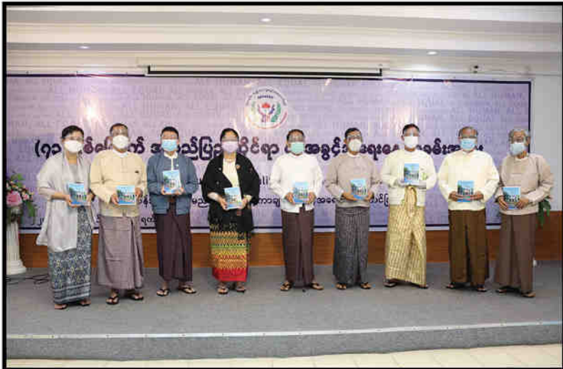
(၇၃) နှစ်မြောက် အပြည်ပြည်ဆိုင်ရာ လူ့အခွင့်အရေးနေ့ အခမ်းအနားတွင် ကော်မရှင် ဥက္ကဋ္ဌ၊ ဒုတိယဥက္ကဋ္ဌနှင့် အဖွဲ့ဝင်များ ကော်မရှင် ၁၀ နှစ်တာခရီး စာအုပ် မိတ်ဆက်ဖြန့်ချိခြင်း (၁၀-၁၂-၂၀၂၁)