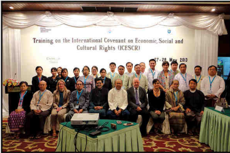
Training on the International Covenant on Economic, Social and Cultural Rights (ICESCR) (၂၇-၅-၂၀၁၃)