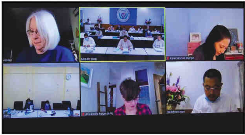
MNHR နှင့် APF တို့ High Level Dialogue ဆွေးနွေးပွဲ (၄-၈-၂၀၂၀)