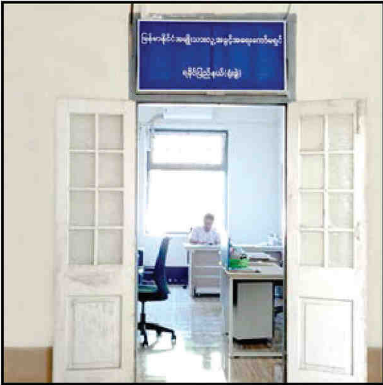
မြန်မာနိုင်ငံအမျိုးသားလူ့အခွင့်အရေးကော်မရှင် ရခိုင်ပြည်နယ် (ရုံးခွဲ)