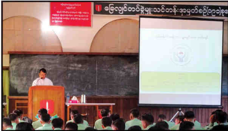
တပ်မတော် (ကြည်း) တိုက်ခိုက်ရေးကျောင်း (ဗထူး) တွင် ဖွင့်လှစ်လျက်ရှိသည့် မြေလျင်တပ်ရင်းမှူးသင်တန်းနှင့် မြေလျင်တပ်ခွဲမှူးသင်တန်းများသို့ သွားရောက်၍ လူ့အခွင့်အရေး အသိပညာပေး ဟောပြောဆွေးနွေးခြင်း (၁-၈-၂၀၁၆)