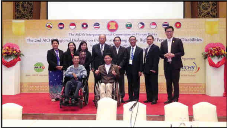
မြန်မာနိုင်ငံအမျိုးသားလူ့အခွင့်အရေးကော်မရှင်မှ မသန်စွမ်းသူများအခွင့်အရေး ဆိုင်ရာ အစည်းအဝေးတက်ရောက်ခြင်း (၂၉-၆-၂၀၁၆)