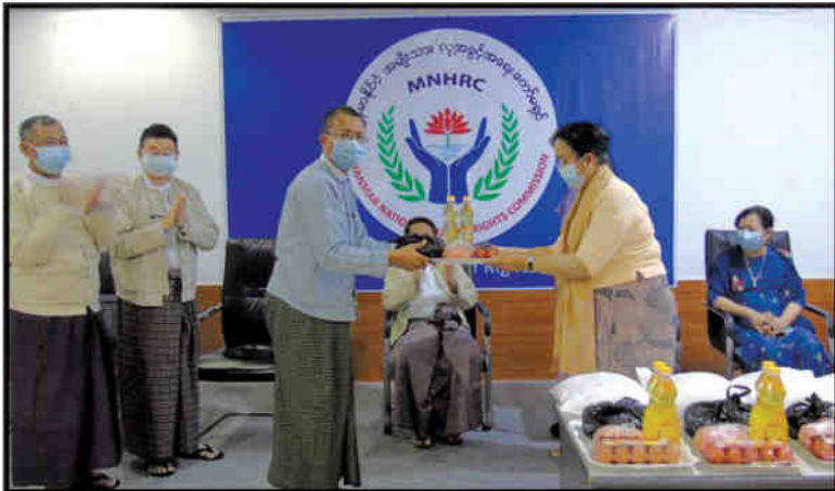
ကော်မရှင်ရုံးဝန်ထမ်းများအား အခြေခံစားသောက်ကုန်ပစ္စည်းများ ထောက်ပံ့ခြင်း (၇-၅-၂၀၂၁)