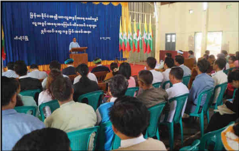
ကော်မရှင် ဒုတိယဥက္ကဋ္ဌ ဦးစစ်မြိုင် ဦးဆောင်သောအဖွဲ့သည် ရှမ်းပြည်နယ်၊ ဖယ်ခုံ မြို့နှင့် ပအိုဝ်းကိုယ်ပိုင် အုပ်ချုပ်ခွင့်ရဒေသများအတွင်းရှိ ဆီဆိုင်မြို့နှင့် ပင်လောင်း မြို့များတွင် လူ့အခွင့်အရေးအကြောင်းသိကောင်းစရာ ရှင်းလင်းဆွေးနွေးပွဲများ ကျင်းပခြင်း (၁-၇-၂၀၁၉)