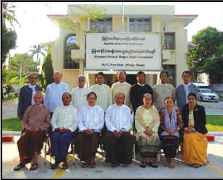
၂၀၁၁ ခုနှစ်မှ ၂၀၁၄ ခုနှစ်အထိ တာဝန်ထမ်းဆောင်ခဲ့သော ကော်မရှင်အဖွဲ့ဝင်များ