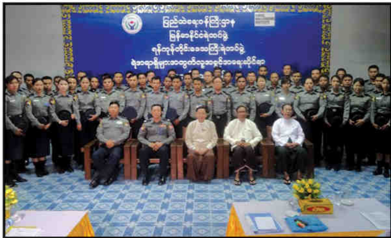
မြန်မာနိုင်ငံ အမျိုးသား လူ့အခွင့်အရေးကော်မရှင်၊ ၂၀၁၇ ခုနှစ် လုပ်ငန်းအစီအစဉ် အရ ရန်ကုန်တိုင်းဒေသကြီးရဲတပ်ဖွဲ့မှူးရုံး ကွပ်ကဲမှုအောက် ရဲအရာရှိများအတွက် လူ့အခွင့်အရေးဆိုင်ရာ အလုပ်ရုံဆွေးနွေးပွဲကျင်းပခြင်း (၂၅-၁-၂၀၁၇)