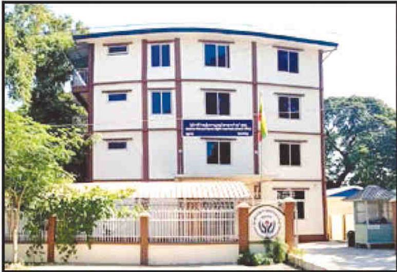
မြန်မာနိုင်ငံအမျိုးသားလူ့အခွင့်အရေးကော်မရှင် မန္တလေး (ရုံးခွဲ)