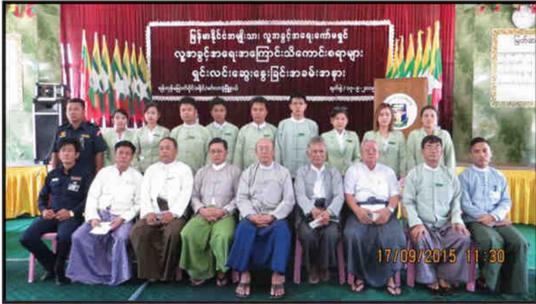
ရန်ကုန်မြောက်ပိုင်းခရိုင်၊ မင်္ဂလာဒုံမြို့နယ်တွင် လူ့အခွင့်အရေးအကြောင်း သိကောင်းစရာများ ရှင်းလင်းဆွေးနွေးခြင်း အခမ်းအနား ကျင်းပခြင်း (၁၇-၉-၂၀၁၅)