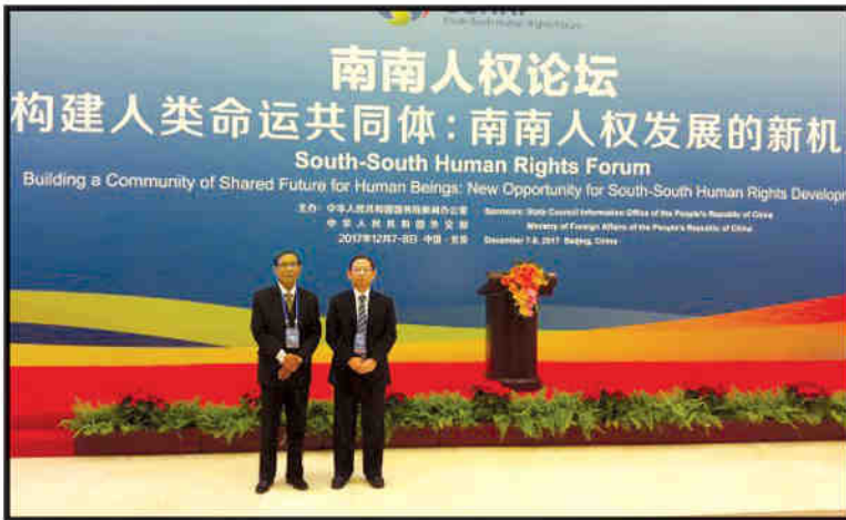
South - South Human Rights Forum သို့ မြန်မာနိုင်ငံအမျိုးသားလူ့အခွင့်အရေးကော်မရှင်မှ တက်ရောက်ခြင်း (၇-၁၂-၂၀၁၇)