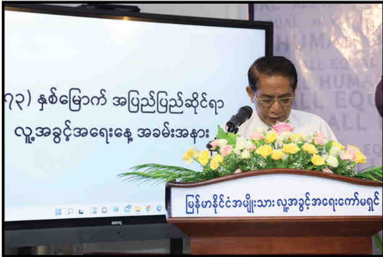
(၇၃) နှစ်မြောက် အပြည်ပြည်ဆိုင်ရာ လူ့အခွင့်အရေးနေ့ အခမ်းအနားတွင် ကော်မရှင် ဥက္ကဋ္ဌမှ အဖွင့်အမှာစကားပြောကြားခြင်း(၁၀-၁၂-၂၀၂၁)