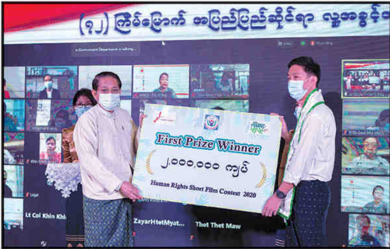
(၇၂) ကြိမ်မြောက် အပြည်ပြည်ဆိုင်ရာ လူ့အခွင့်အရေးနေ့ အခမ်းအနားတွင် ဆုရရှိသူများအား ဆုချီးမြှင့်ခြင်း (၁၀-၁၂-၂၀၂၀)