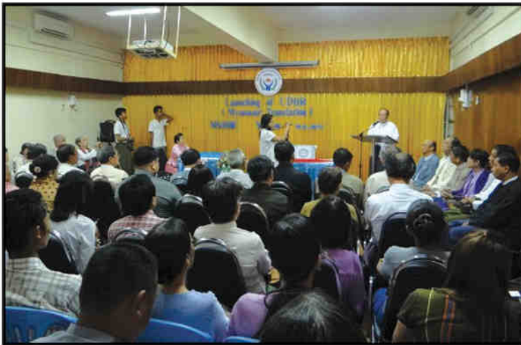
ကမ္ဘာ့လူ့အခွင့်အရေးကြေညာစာတမ်း (မြန်မာဘာသာပြန်) ထုတ်ဝေပြန်ချိသည့် အခမ်းအနားကျင်းပခြင်း (၁၈-၆-၂၀၁၃)