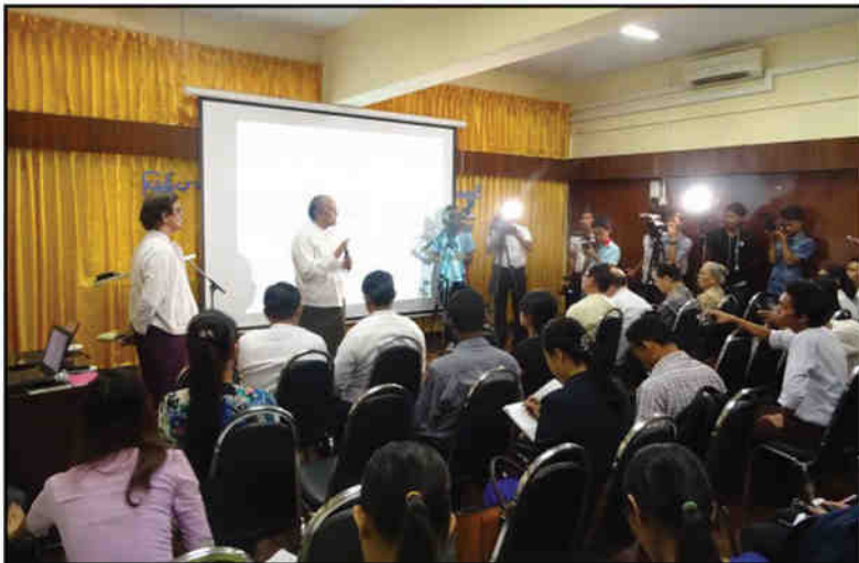
မြန်မာနိုင်ငံ အမျိုးသား လူ့အခွင့်အရေး ကော်မရှင်၏ လူ့အခွင့်အရေး မြှင့်တင်/ ကာကွယ်ရေး လုပ်ငန်းများနှင့် စပ်လျဉ်း၍ သတင်းစာရှင်းလင်းပွဲ ပြုလုပ်ခြင်း (၄-၁၂-၂၀၁၅)