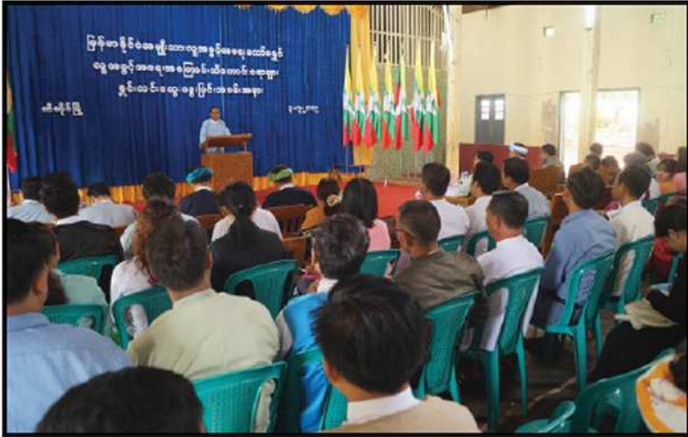
ကော်မရှင် ဒုတိယဥက္ကဋ္ဌ ဦးစစ်မြိုင် ရှမ်းပြည်နယ်၊ ဖယ်ခုံမြို့နှင့် ပအိုဝ်းကိုယ်ပိုင်အုပ်ချုပ်ခွင့်ရဒေသ ဆီဆိုင်မြို့နှင့် ပင်လောင်းမြို့တို့တွင် လူ့အခွင့်အရေးအကြောင်း သိကောင်းစရာ ရှင်းလင်းဆွေးနွေးပွဲများ ကျင်းပခြင်း (၂၀၁၉)