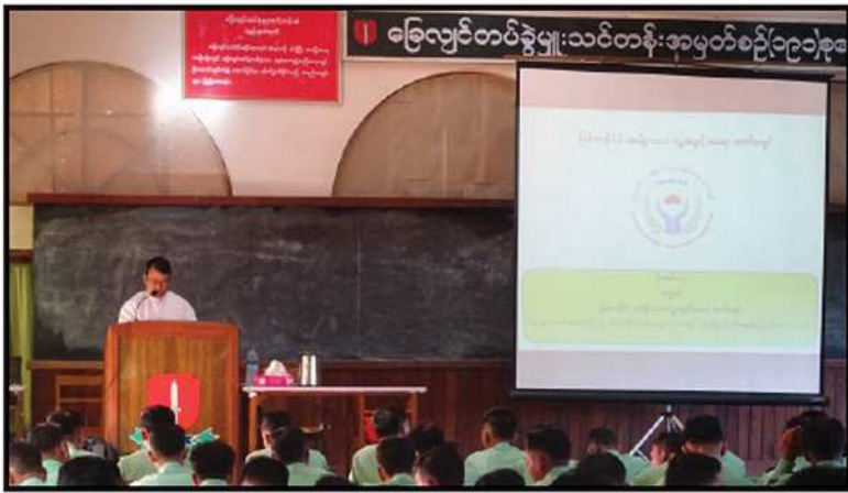
တပ်မတော် (ကြည်း) တိုက်ခိုက်ရေးကျောင်း (ဗထူး) တွင် ဖွင့်လှစ်လျက်ရှိသည့် ခြေလျင်တပ်ရင်းမှူးသင်တန်းနှင့် ခြေလျင်တပ်ခွဲမှူးသင်တန်းများသို့ သွားရောက်၍ လူ့အခွင့်အရေး အသိပညာပေး ဟောပြောဆွေးနွေးခြင်း (၂၀၁၆)