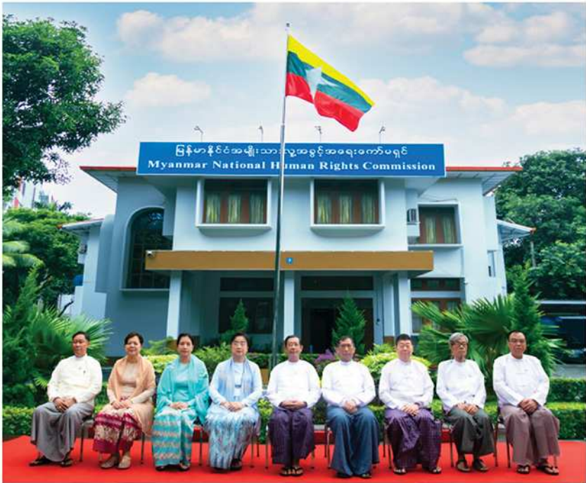
လက်ရှိအချိန်ထိ တာဝန်ထမ်းဆောင်လျက်ရှိသည့် ကော်မရှင်အဖွဲ့ဝင်များ