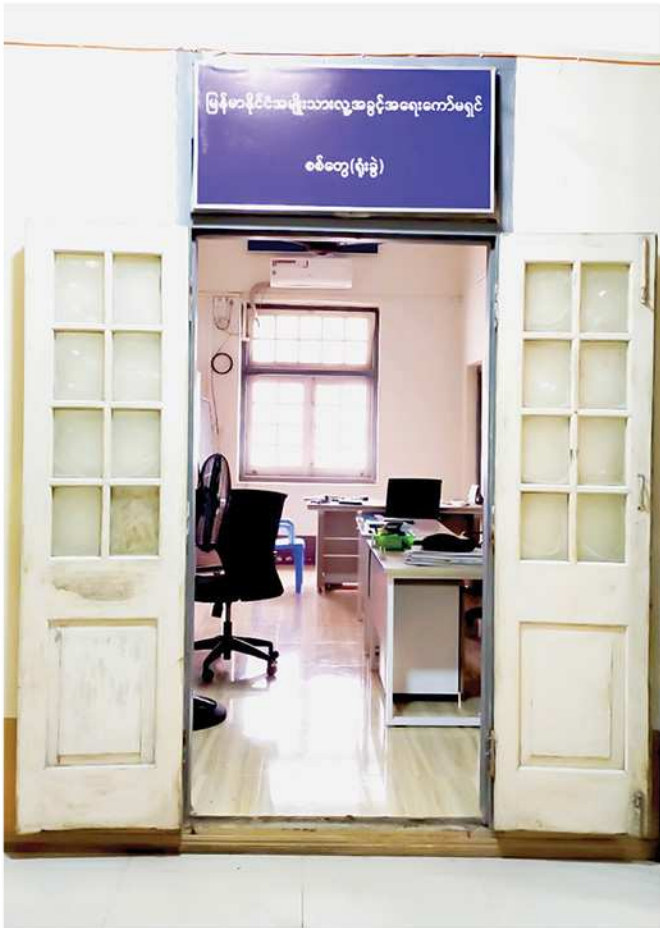
မြန်မာနိုင်ငံအမျိုးသားလူ့အခွင့်အရေးကော်မရှင် စစ်တွေ (ရုံးခွဲ)