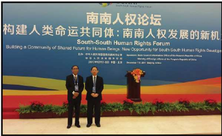
South - South Human Rights Forum သို့ မြန်မာနိုင်ငံအမျိုးသားလူ့အခွင့်အရေးကော်မရှင်မှ တက်ရောက်ခြင်း တရုတ်နိုင်ငံ၊ ပေကျင်းမြို့ (၂၀၁၇)