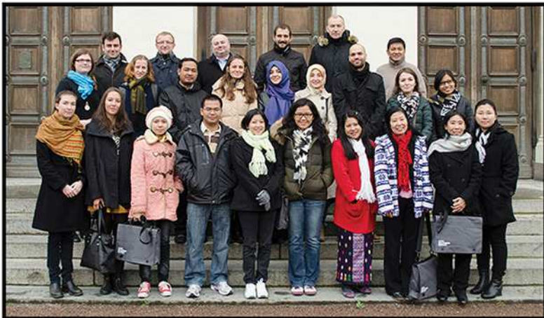
ကော်မရှင်ရုံးဝန်ထမ်းများ စွမ်းရည်မြှင့်တင်ရန် ဆွီဒင်နိုင်ငံတွင် သင်တန်းတက်ရောက်ခြင်း (၂၀၁၄)