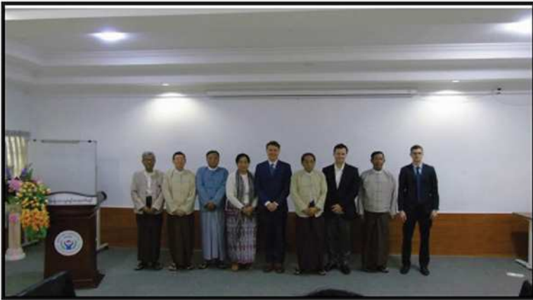
မြန်မာနိုင်ငံအမျိုးသားလူ့အခွင့်အရေးကော်မရှင်နှင့် ကုလသမဂ္ဂဖွံ့ဖြိုးမှုအစီအစဉ် (UNDP) မှ ကိုယ်စားလှယ်အဖွဲ့တို့ တွေ့ဆုံဆွေးနွေးခြင်း (၂၀၂၁)