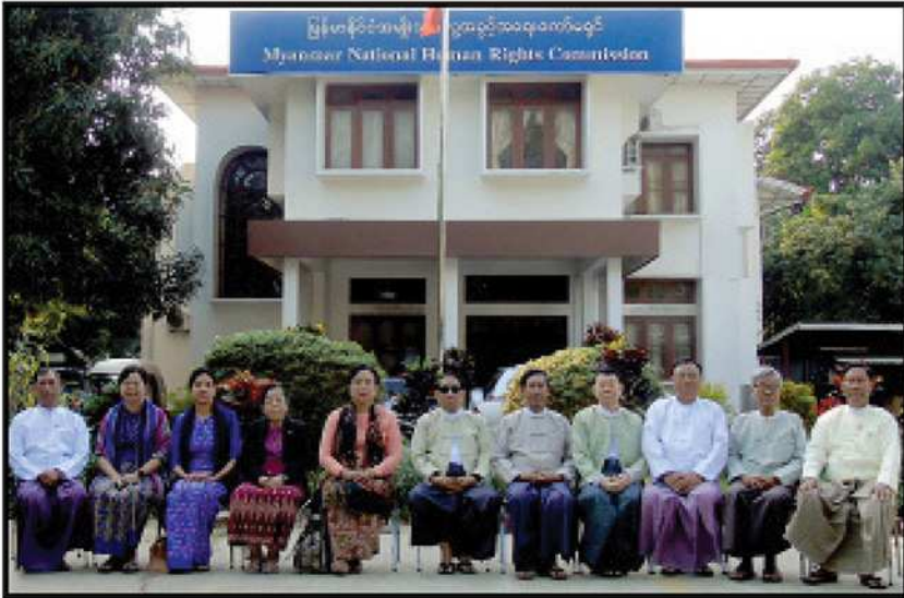
၂၀၂၀ ပြည့်နှစ်မှ ၂၀၂၃ ခုနှစ်၊ ဩဂုတ်လ ၂ ရက်နေ့ထိ တာဝန်ထမ်းဆောင်ခဲ့သည့် ကော်မရှင်အဖွဲ့ဝင်များ

မြန်မာနိုင်ငံအမျိုးသားလူ့အခွင့်အရေးကော်မရှင်တွင် တာဝန်ထမ်းဆောင်လျက်ရှိသည့် ကော်မရှင်အဖွဲ့ဝင်များကို တပ်မတော်ကာကွယ်ရေးဦးစီးချုပ်ရုံး၏ အမိန့်အမှတ် (၄/၂၀၂၁) ဖြင့် ၂၀၂၁ ခုနှစ်၊ ဖေဖော်ဝါရီလ ၁ ရက်နေ့တွင် ဆက်လက်တာဝန်ထမ်းဆောင်ရန် တာဝန်ပေးအပ်ခဲ့ပါသည်။