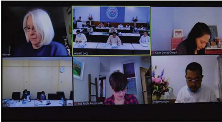
MNHRIC နှင့် APF တို့ High Level Dialogue ဆွေးနွေးပွဲ ကျင်းပခြင်း (၂၀၂၀)