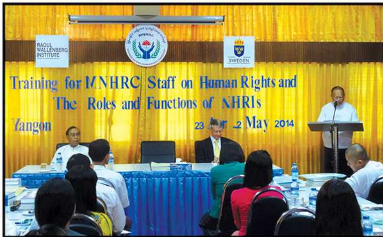
ကော်မရှင်ရုံးဝန်ထမ်းများအတွက် လူ့အခွင့်အရေးဆိုင်ရာ သင်တန်းဖွင့်လှစ်ခြင်း (၂၀၁၄)