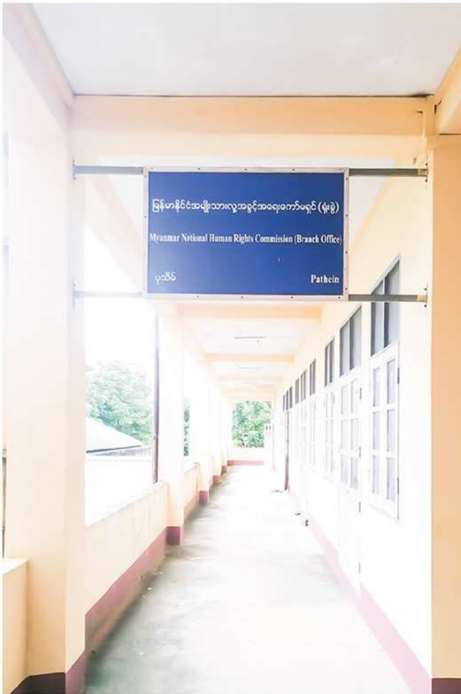
မြန်မာနိုင်ငံအမျိုးသားလူ့အခွင့်အရေးကော်မရှင် ပုသိမ် (ရုံးခွဲ)