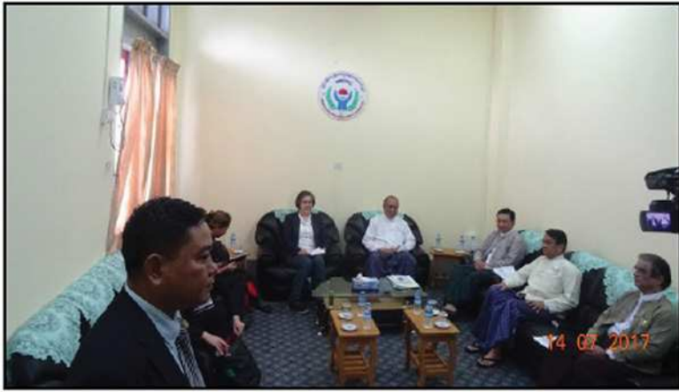
ကုလသမဂ္ဂ၏မြန်မာနိုင်ငံလူ့အခွင့်အရေးအခြေအနေဆိုင်ရာ အထူးအစီရင်ခံစာ တင်သွင်းသူ မစ္စရန်ဟီလီ မြန်မာနိုင်ငံအမျိုးသားလူ့အခွင့်အရေးကော်မရှင်သို့ လာရောက်တွေ့ဆုံခြင်း (၂၀၁၇)