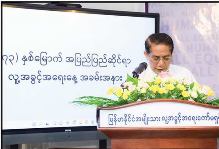
(၇၃) နှစ်မြောက် အပြည်ပြည်ဆိုင်ရာ လူ့အခွင့်အရေးနေ့ အခမ်းအနား ပြန်ဟန်ိုင်င်အပျိုးသား လူ့အခွင့်အရေးကော်မရှင် (၇၃) နှစ်မြောက် အပြည်ပြည်ဆိုင်ရာလူ့အခွင့်အရေးနေ့ အခမ်းအနားတွင် ကော်မရှင်ဥက္ကဋ္ဌ ဦးလှမြင့် အဖွင့်အမှာစကားပြောကြားခြင်း (၂၀၂၁)