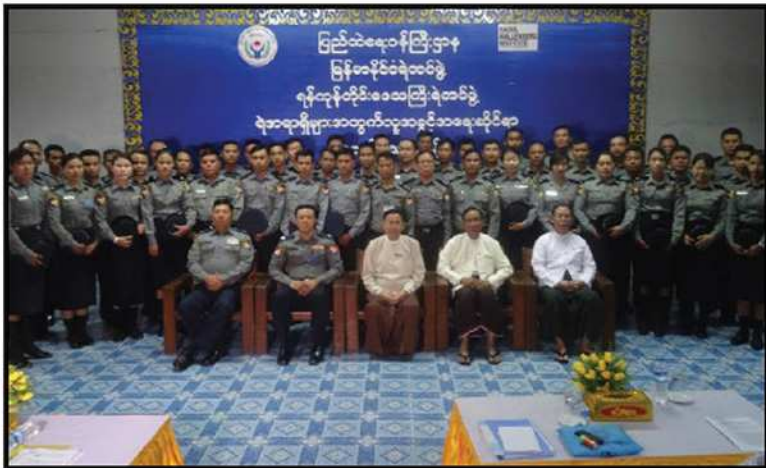
ရန်ကုန်တိုင်းဒေသကြီး ရဲတပ်ဖွဲ့မှူးရုံး ကွပ်ကဲမှုအောက် ရဲအရာရှိများအတွက် လူ့အခွင့်အရေးဆိုင်ရာ အလုပ်ရုံဆွေးနွေးပွဲကျင်းပခြင်း (၂၀၁၇)