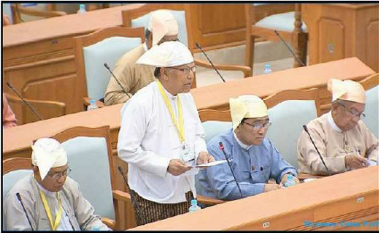
ဒုတိယအကြိမ် ပြည်ထောင်စုလွှတ်တော် အဋ္ဌမပုံမှန်အစည်းအဝေး စတုတ္ထနေ့ လွှတ်တော်ကိုယ်စားလှယ်များ၏ ဆွေးနွေးချက်များအပေါ် မြန်မာနိုင်ငံအမျိုးသား လူ့အခွင့်အရေးကော်မရှင်ဥက္ကဋ္ဌ ဦးဝင်းမြ ပြန်လည်ရှင်းလင်း တင်ပြခြင်း (၂၀၁၈)