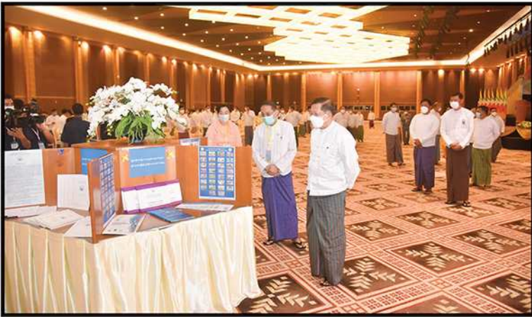
နိုင်ငံတော်စီမံအုပ်ချုပ်ရေးကောင်စီ ဥက္ကဋ္ဌ၊ နိုင်ငံတော်ဝန်ကြီးချုပ် ဗိုလ်ချုပ်မှူးကြီး မင်းအောင်လှိုင် (၇၄) နှစ်မြောက် အပြည်ပြည်ဆိုင်ရာ လူ့အခွင့်အရေးနေ့ အထိမ်းအမှတ် အခမ်းအနားတွင် ခင်းကျင်းပြသထားသည့် ပြခန်းများအား လှည့်လည်ကြည့်ရှုခြင်း (၂၀၂၂)