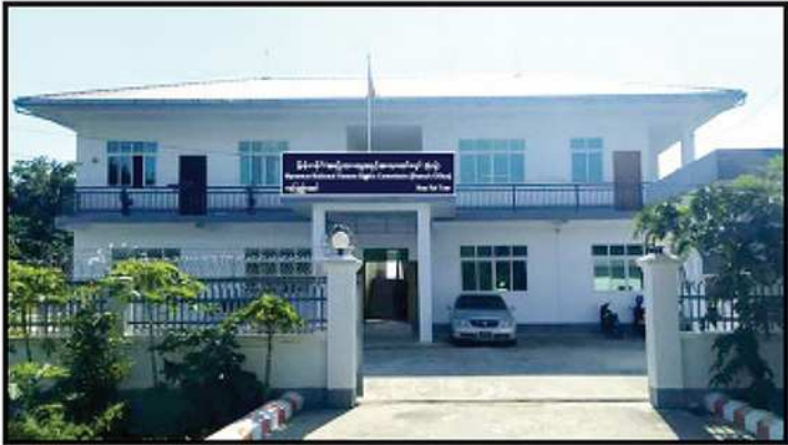
မြန်မာနိုင်ငံအမျိုးသားလူ့အခွင့်အရေးကော်မရှင် နေပြည်တော် (ရုံးခွဲ)

ကို ရခိုင်ပြည်နယ် အထွေထွေအုပ်ချုပ်ရေးဦးစီးဌာနရုံးဝင်း၊ စစ်တွေမြို့တွင် လည်းကောင်း၊ ကော်မရှင် ပုသိမ် (ရုံးခွဲ) ကို မြို့နယ်စုပေါင်းရုံးဝင်း၊ ပုသိမ် မြို့တွင်လည်းကောင်း ဖွင့်လှစ်ထားရှိပါသည်။ ကော်မရှင်ရုံး ဖွဲ့စည်းပုံတွင် အရာထမ်း (၈၇) ဦး၊ အမှုထမ်း (၂၃၅) ဦး စုစုပေါင်း ဝန်ထမ်း (၃၂၂) ဦးရှိပြီး လက်ရှိတွင် အရာထမ်း (၃၇) ဦး၊ အမှုထမ်း (၆၇) ဦး စုစုပေါင်း ဝန်ထမ်း (၁၀၄) ဦးဖြင့် လုပ်ငန်းလည်ပတ်ဆောင်ရွက်လျက်ရှိပါသည်။