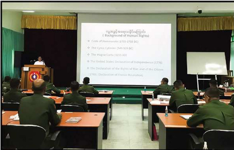
ကော်မရှင်ဥက္ကဋ္ဌ ဦးပေါ်လွင်စိန် နိုင်ငံတော်ကာကွယ်ရေးတက္ကသိုလ်တွင် သင်ခန်းစာပို့ချခြင်း (၂၀၂၃)