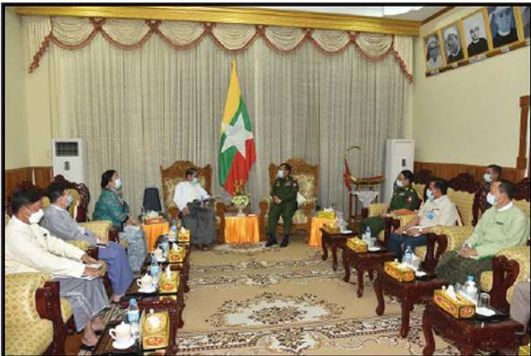
ပြည်ထဲရေးဝန်ကြီးဌာန၊ ပြည်ထောင်စုဝန်ကြီးနှင့် မြန်မာနိုင်ငံအမျိုးသားလူ့အခွင့်အရေးကော်မရှင်တို့ တွေ့ဆုံခြင်း (၂၀၂၁)