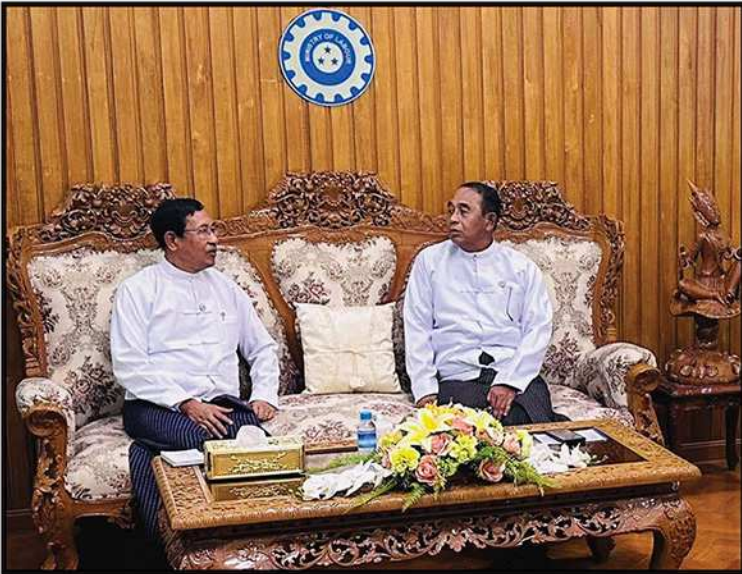
မြန်မာနိုင်ငံအမျိုးသားလူ့အခွင့်အရေးကော်မရှင်ဥက္ကဋ္ဌ ဦးပေါ်လွင်စိန်နှင့် အလုပ်သမားဝန်ကြီးဌာန ပြည်ထောင်စုဝန်ကြီးတို့ တွေ့ဆုံဆွေးနွေးစဉ် (၂၀၂၃)