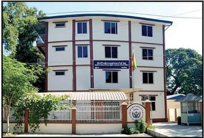
မြန်မာနိုင်ငံအမျိုးသားလူ့အခွင့်အရေးကော်မရှင် မန္တလေး (ရုံးခွဲ)