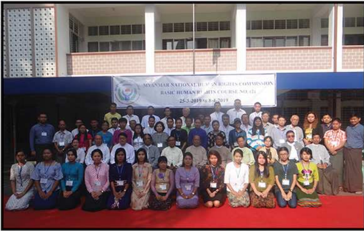
မြန်မာနိုင်ငံအမျိုးသားလူ့အခွင့်အရေးကော်မရှင်ရုံးတွင် လူ့အခွင့်အရေးအခြေခံသင်တန်း ဖွင့်လှစ်ခြင်း (၂၀၁၉)