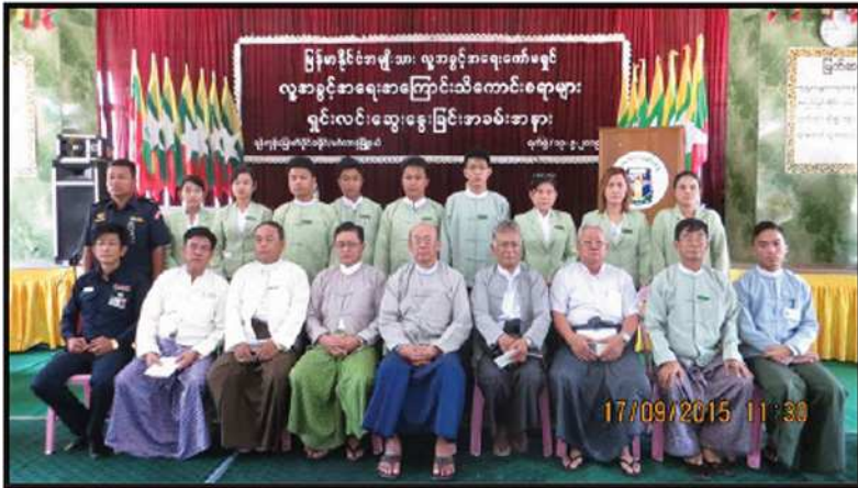
ရန်ကုန်တိုင်းဒေသကြီး၊ မင်္ဂလာဒုံမြို့နယ်တွင် လူ့အခွင့်အရေးဆိုင်ရာ သိကောင်းစရာများ ရှင်းလင်းဆွေးနွေးခြင်း အခမ်းအနားကျင်းပခြင်း (၂၀၁၅)