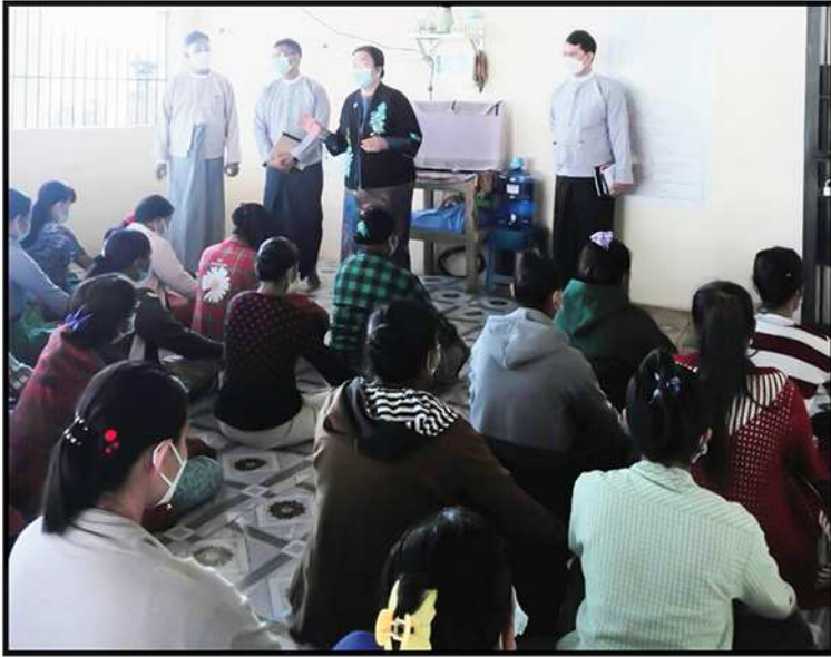
ကော်မရှင်ဒုတိယဥက္ကဋ္ဌ ဒေါက်တာနန္ဒာမွန်းနှင့် ကော်မရှင်အဖွဲ့ဝင် ဦးကျော်မြင့် နေပြည်တော်အချုပ်ထောင်ကို ကြည့်ရှုစစ်ဆေးခြင်း (၂၀၂၂)