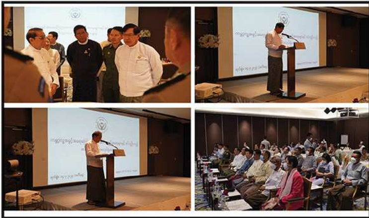
ရန်ကုန်တိုင်းဒေသကြီးအတွင်းရှိ တိုင်းဒေသကြီးအဆင့် အရာရှိများအတွက် ကမ္ဘာ့လူ့အခွင့်အရေးကြေညာစာတမ်းနှင့် စပ်လျဉ်းသည့် အလုပ်ရုံဆွေးနွေးပွဲ ကျင်းပပြုလုပ်ခြင်း (၂၀၂၃)