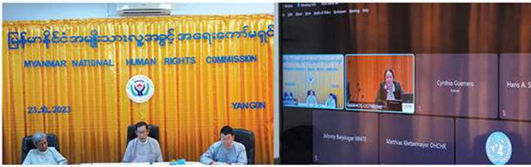
မြန်မာနိုင်ငံ အမျိုးသား လူ့အခွင့်အရေးကော်မရှင် ဥက္ကဋ္ဌနှင့် အဖွဲ့ GANHRI Sub-Committee on Accreditation (SCA) အစည်းအဝေး တက်ရောက်ခြင်း (၂၀၂၃)