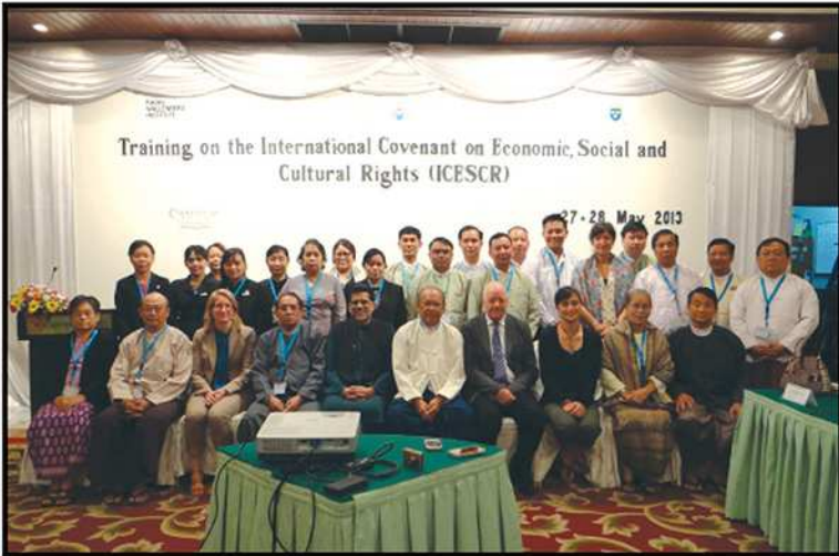
Training on the International Covenant on Economic, Social and Cultural Rights (ICESCR) (၂၀၁၃)