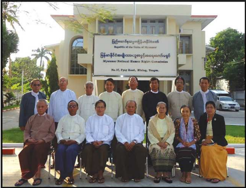
၂၀၁၁ ခုနှစ်မှ ၂၀၁၄ ခုနှစ်အထိ တာဝန်ထမ်းဆောင်ခဲ့သည့် ကော်မရှင်အဖွဲ့ဝင်များ