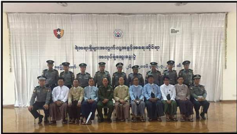
အမှတ် (၁) လုံခြုံရေး ရဲကွပ်ကဲမှု အဖွဲ့မှူးရုံး (နေပြည်တော်) ကွပ်ကဲမှုအောက် ရဲအရာရှိများအတွက် လူ့အခွင့်အရေးဆိုင်ရာ အလုပ်ရုံဆွေးနွေးပွဲ ကျင်းပခြင်း (၂၀၁၆)