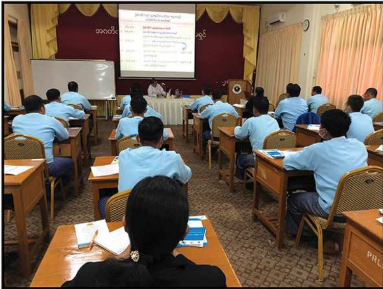
ကော်မရှင်ရုံး၊ ညွှန်ကြားရေးမှူးချုပ် ဦးဘုန်းကြွယ် အကတိလိုက်စားမှုတိုက်ဖျက်ရေးကော်မရှင်တွင် လူ့အခွင့်အရေးဆိုင်ရာသင်ခန်းစာပို့ချခြင်း (၂၀၂၃)