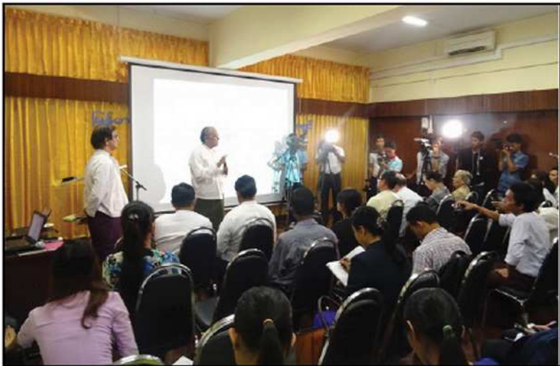
ကော်မရှင်၏ လူ့အခွင့်အရေးမြှင့်တင်ရေးနှင့် ကာကွယ်စောင့်ရှောက်ရေး လုပ်ငန်းများနှင့် စပ်လျဉ်း၍ သတင်းစာရှင်းလင်းပွဲ ပြုလုပ်ခြင်း (၂၀၁၅)