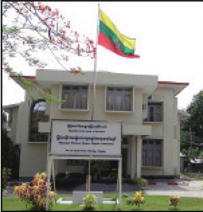
မြန်မာနိုင်ငံ အမျိုးသား လူ့အခွင့်အရေး ကော်မရှင်ရုံး