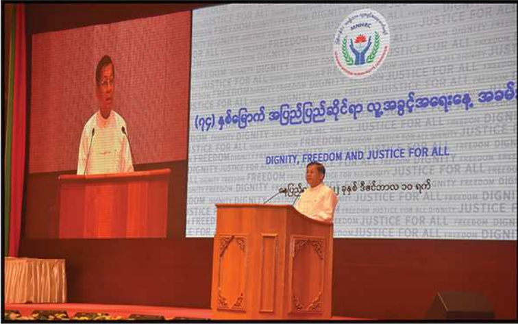
နိုင်ငံတော်စီမံအုပ်ချုပ်ရေးကောင်စီ ဥက္ကဋ္ဌ၊ နိုင်ငံတော်ဝန်ကြီးချုပ် ဗိုလ်ချုပ်မှူးကြီး မင်းအောင်လှိုင် (၇၄) နှစ်မြောက် အပြည်ပြည်ဆိုင်ရာ လူ့အခွင့်အရေးနေ့ အထိမ်းအမှတ်အခမ်းအနားတွင် အမှာစကားပြောကြားခြင်း (၂၀၂၂)