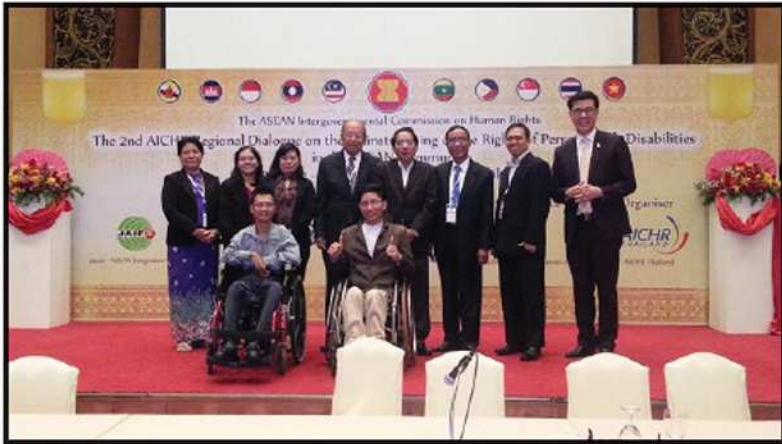
မြန်မာနိုင်ငံအမျိုးသားလူ့အခွင့်အရေးကော်မရှင်မှ မသန်စွမ်းသူများအခွင့်အရေးဆိုင်ရာ အစည်းအဝေးတက်ရောက်ခြင်း ထိုင်းနိုင်ငံ၊ ချင်းမိုင်မြို့ (၂၀၁၆)