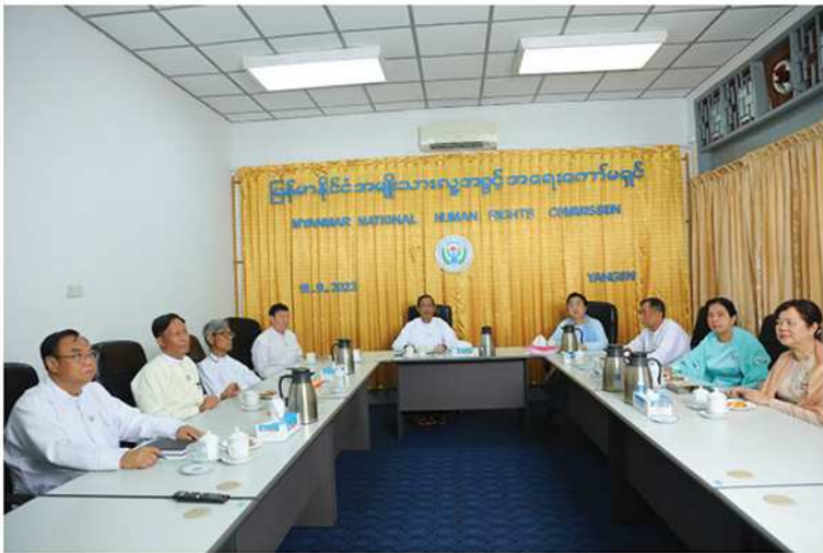
မြန်မာနိုင်ငံအမျိုးသားလူ့အခွင့်အရေးကော်မရှင် ဥက္ကဋ္ဌ၊ ဒုတိယဥက္ကဋ္ဌနှင့် ကော်မရှင်အဖွဲ့ဝင်များ (၂၀၂၃)