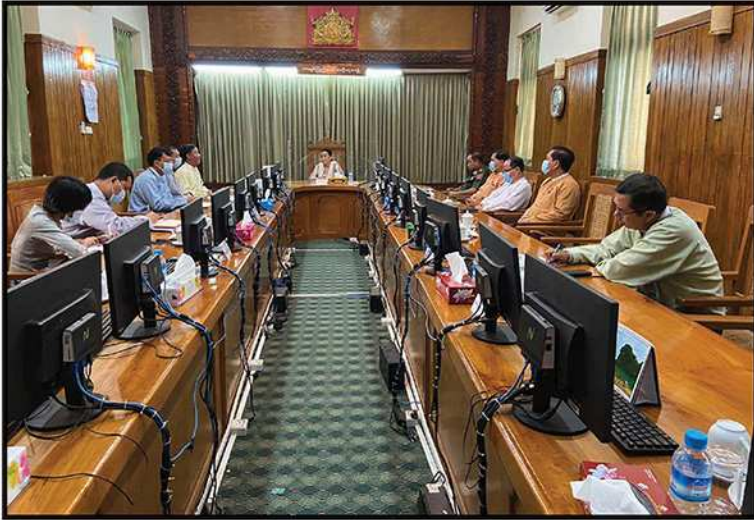
ကရင်ပြည်နယ်ဝန်ကြီးချုပ်နှင့် ကော်မရှင်အဖွဲ့ဝင် ဦးကျော်မြင့်နှင့် ဦးကျော်စိုး လူ့အခွင့်အရေးဆိုင်ရာကိစ္စရပ်များနှင့် စပ်လျဉ်း၍ တွေ့ဆုံဆွေးနွေးခြင်း (၂၀၂၀)