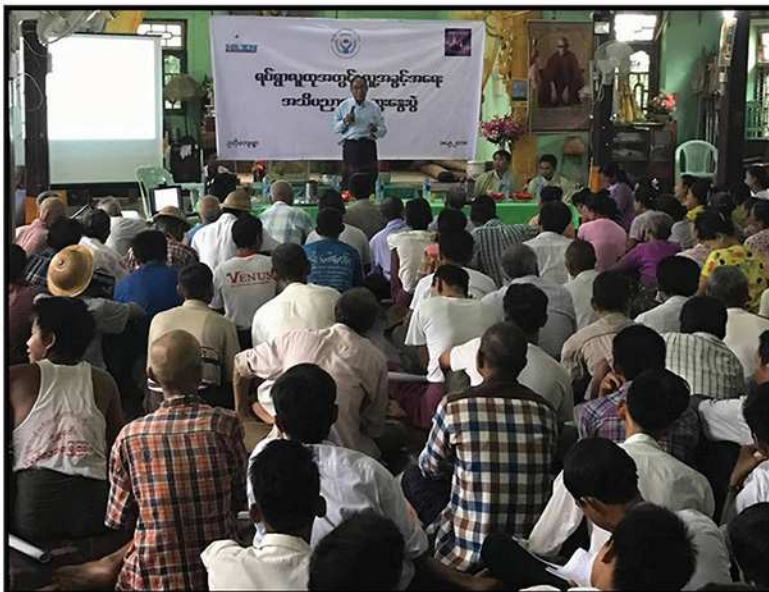
ကော်မရှင်ဒုတိယဥက္ကဋ္ဌ ဦးစစ်မြိုင် ရပ်ရွာလူထုအတွင်း လူ့အခွင့်အရေးအသိပညာပေး ဆွေးနွေးပွဲကျင်းပခြင်း (၂၀၁၈)