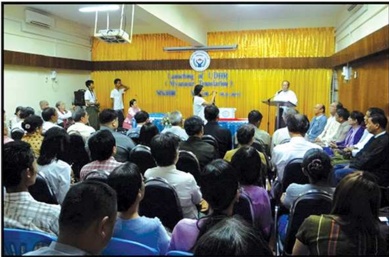
ကမ္ဘာ့လူ့အခွင့်အရေးကြေညာစာတမ်း (မြန်မာဘာသာပြန်) ထုတ်ဝေဖြန့်ချိသည့် အခမ်းအနားကျင်းပခြင်း (၂၀၁၃)