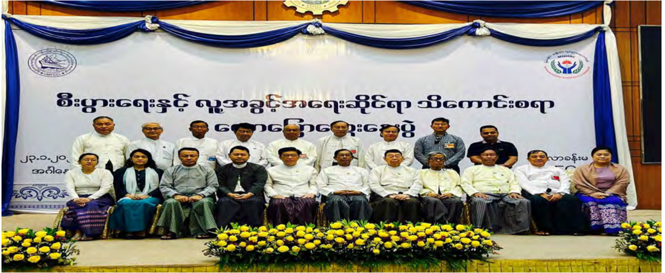
မြန်မာနိုင်ငံ အမျိုးသား လူ့အခွင့်အရေး ကော်မရှင်နှင့် ပြည်ထောင်စုသမ္မတ မြန်မာနိုင်ငံကုန်သည်များနှင့် စက်မှုလက်မှုလုပ်ငန်းရှင်များ အသင်းချုပ်တို့ စီးပွားရေးနှင့် လူ့အခွင့်အရေးဆိုင်ရာ သိကောင်းစရာ ဟောပြောဆွေးနွေးပွဲတွင် စုပေါင်းမှတ်တမ်းဓာတ်ပုံရိုက်ကူးစဉ်။

https://mnhrc.org.mm/publication/e-Newsletter