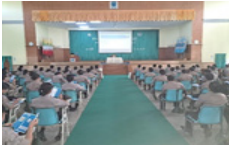
နိုင်ငံဝန်ထမ်းတက္ကသိုလ် (အောက်မြန်မာပြည်) ၌ ဖွင့်လှစ်လျက်ရှိသော သင်တန်းတွင် လူ့အခွင့်အရေးဆိုင်ရာ သင်ခန်းစာ သွားရောက်ပို့ချ