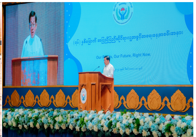
နိုင်ငံတော်စီမံအုပ်ချုပ်ရေးကောင်စီဥက္ကဋ္ဌ နိုင်ငံတော်ဝန်ကြီးချုပ် ဗိုလ်ချုပ်မှူးကြီးမင်းအောင်လှိုင် (၇၆) နှစ်မြောက် အပြည်ပြည်ဆိုင်ရာလူ့အခွင့်အရေးနေ့အခမ်းအနားတွင် အမှာစကား ပြောကြားစဉ်