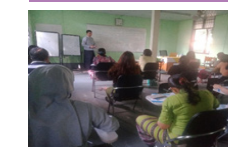
သက်ကြီးရွယ်အိုများနေ့စောင့်ရှောက်ရေးဂေဟာတွင် သင်ခန်းစာသွားရောက်ပို့ချ