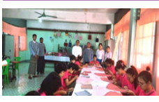
ကော်မရှင်မှ အမျိုးသမီးသက်မွေးအတတ်ပညာသင်ကျောင်း (ရန်ကုန်) အား ကြည့်ရှုစစ်ဆေးခြင်း