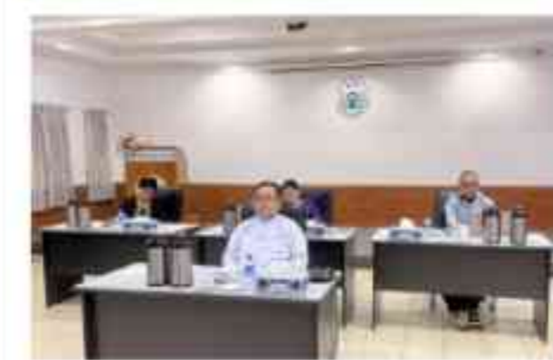
အရှေ့တောင်အာရှအမျိုးသားလူ့အခွင့်အရေးအဖွဲ့အစည်းများဖိရစ်၏ ပထမအကြိမ်လုပ်ငန်းအဖွဲ့ အစည်းအဝေးနှင့် ဆက်စပ်ဆွေးနွေးပွဲများသို့ မြန်မာနိုင်ငံ အမျိုးသား လူ့အခွင့်အရေးကော်မရှင် ပါဝင်တက်ရောက်ခြင်း