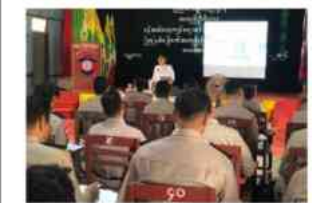
ဝန်ထမ်းလေ့ကျင့်ရေးသင်တန်းကျောင်း (မန္တလေး) ၌ သင်ခန်းစာ သွားရောက်ပို့ချ