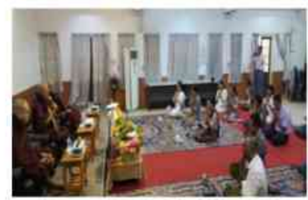
၁၃၀၈ ခုနှစ် မြန်မာနှစ်ဆန်း (၁) ရက်နေ့ နှစ်သစ်ကူးအန္တရာယ်ကင်းပရိတ်တရားတော် နာယူပွဲကျင်းပခြင်း