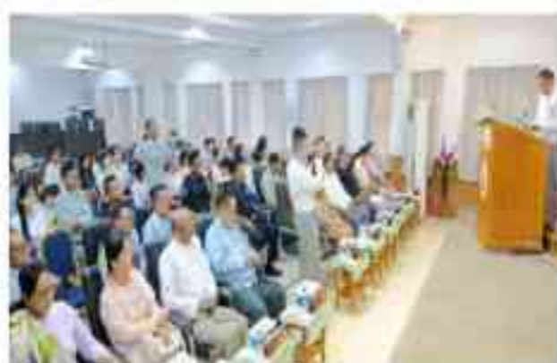
မီးဘေးအန္တရာယ်ကင်းရှင်းရေးအသိပညာပေးဟောပြောခြင်းနှင့် လက်တွေ့မီးငြှိမ်းသတ်ရေးသရုပ်ပြခြင်း